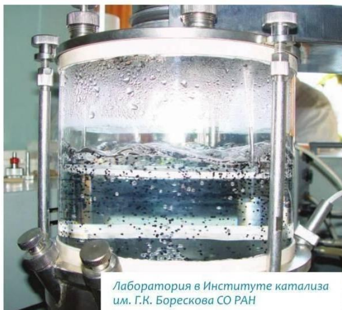
Лаборатория в Институте катализа им. Г.К. Борескова СО РАН

приходили люди самых разных научных специальностей, здесь они обучались, воспитывались, и в результате родился уникальный междисциплинарный коллектив. В настоящий момент в институте работает чуть менее тысячи человек. Это достаточно много. Эти люди одновременно работают и на фундаментальную науку, и на прикладную. Наш институт — один из самых крупных химических институтов России.