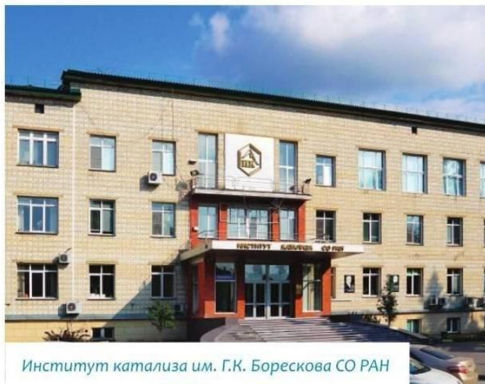
Институт катализа им. Г.К. Борескова СО РАН

Задача катализа состоит в том, чтобы активировать кислород более мягким образом, чтобы он стал реакционно способным. Не обязательно в таком простом процессе, как сжигание до \text{CO}_2 и воды, а в селективном окислении, например в превращении метанола в формальдегид и многих других реакциях получения ценных химических продуктов. Процессы активации кислорода изучаются у нас в институте, и достигнуты серьезные успехи: например, мы выяснили, что чем сложнее молекулы субстратов, тем при более мягких условиях должен быть активирован кислород. Мы работаем над этим вместе с нашими коллегами из Института органической химии им. Н.Д. Зелинского РАН в Москве. Для таких мягких метаморфоз используется катализ в органическом синтезе с атомарной точностью.